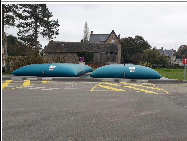
2 bâches de 120 m 3 au sud du site