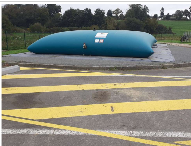
1 bâche 120 m 3 au nord