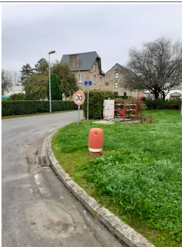
Poteau incendie entrée sud