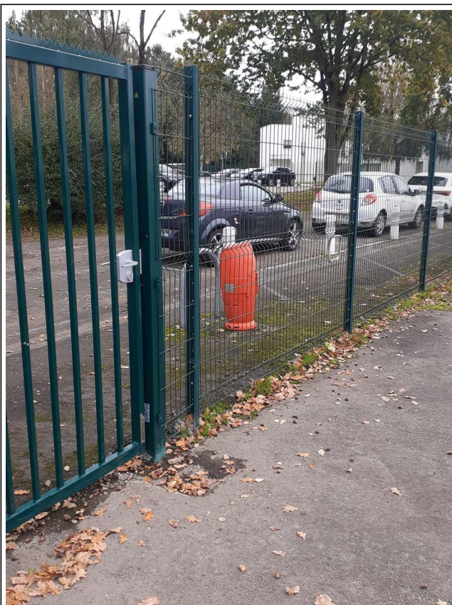
Poteau incendie entrée nord + portillon aménagé